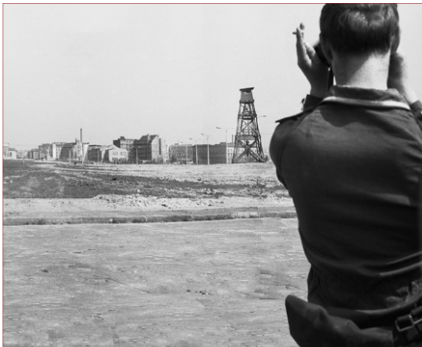
©BArch_DVH 60 Bild-GR 33-09-01 und BArch, DVH 60 Bild-GR 33-09-03, o. Ang. ; Rekonstruktion und Interpretation Arwed Messmer

Dans le cadre de l'exposition, diverses animations seront proposées par le Théâtre Ainsi de Suite.